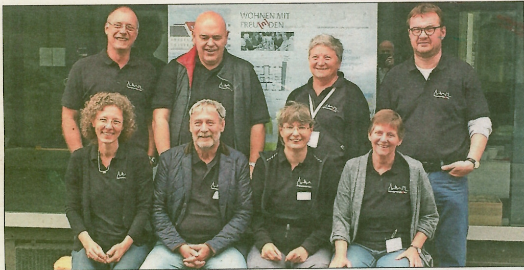
Haben gemeinsam viel vor: Vier Paare planen das ungewöhnliche Projekt.