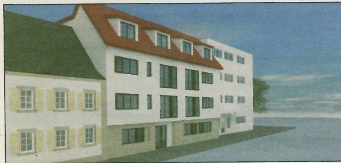
Der geplante Neubau fügt sich in den Bestand ein.

Wer sich für das Projekt interessiert und die Gruppe kennenlernen möchte, kann sich per E-Mail an info@wohnenmitfreunden-lu.de oder telefonisch mit Margit Hey-Sparr in Verbindung setzen: 0621 672267 (E-Mail: margit.hey-sparr@t-online.de ). Weitere Infos und Pläne zu dem Wohnprojekt gibt es außerdem im Netz unter www.i3-community.de .